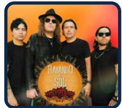
SHOW Grupo Rayando el Sol Tributo a Maná