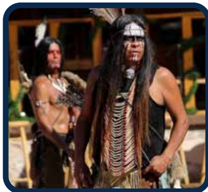
SHOW Paseo del Viejo Oeste Espectáculo cowboy